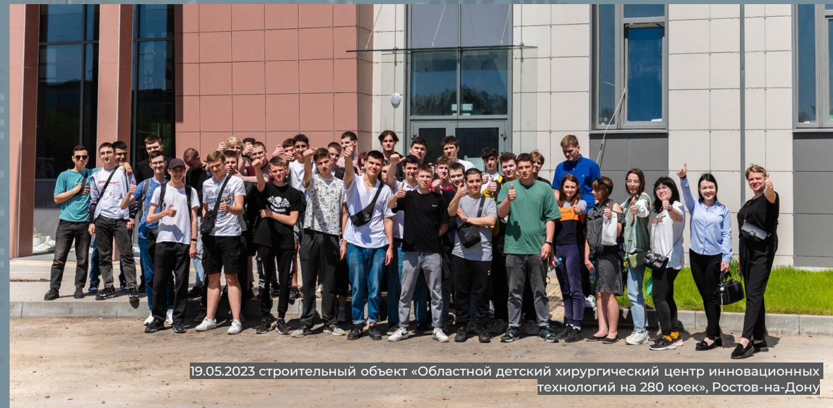
19.05.2023 строительный объект «Областной детский хирургический центр инновационных технологий на 280 коек», Ростов-на-Дону