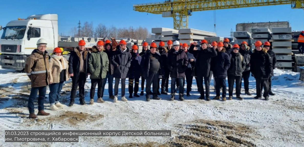
01.03.2023 строящийся инфекционный корпус Детской больницы им. Пиотровича, г. Хабаровск