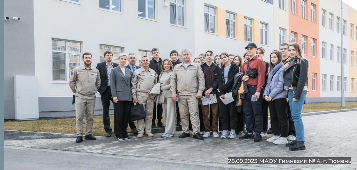
28.09.2023 МАОУ Гимназия № 4, г. Тюмень