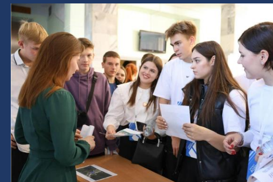
📍 Нижний Новгород 13-14 сентября 2023