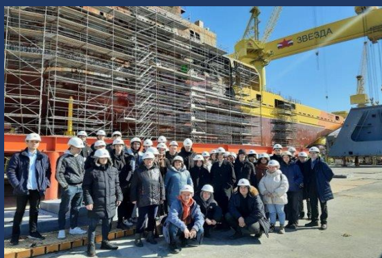
📍 Владивосток 3-4 марта 2023