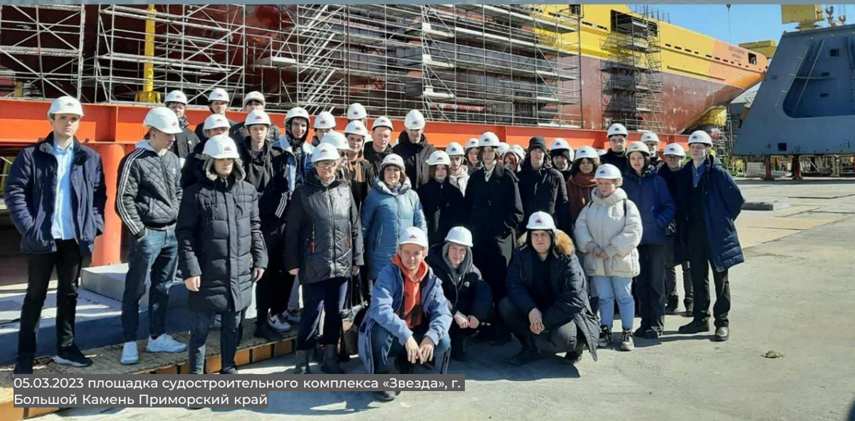
05.03.2023 площадка судостроительного комплекса «Звезда», г. Большой Камень Приморский край