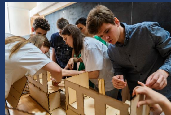
📍 Ростов-на-Дону 18-19 мая 2023