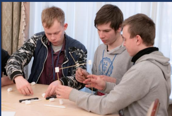
📍 Санкт-Петербург 16-17 декабря 2022 19 октября 2023