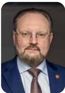
Игорь Евгеньевич МАНЫЛОВ

НАЧАЛЬНИК ГЛАВГОСЭКСПЕРТИЗЫ РОССИИ, ПРЕДСЕДАТЕЛЬ РЕДАКЦИОННОГО СОВЕТА ЖУРНАЛА «ВЕСТНИК ГОСУДАРСТВЕННОЙ ЭКСПЕРТИЗЫ»