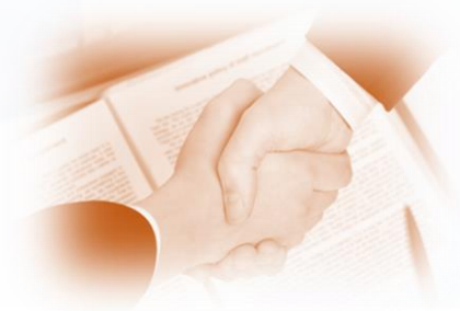
Договор об экспертном сопровождении на 1 год

Срок проведения государственной экспертизы в форме экспертного сопровождения будет составлять не более 10 рабочих дней и может быть продлен, но не более чем на 10 рабочих дней