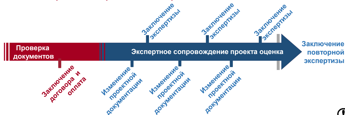
Схема экспертного сопровождения проекта:

Сведения о выдаваемом в таком случае заключении подлежат включению в ЕПРЗ